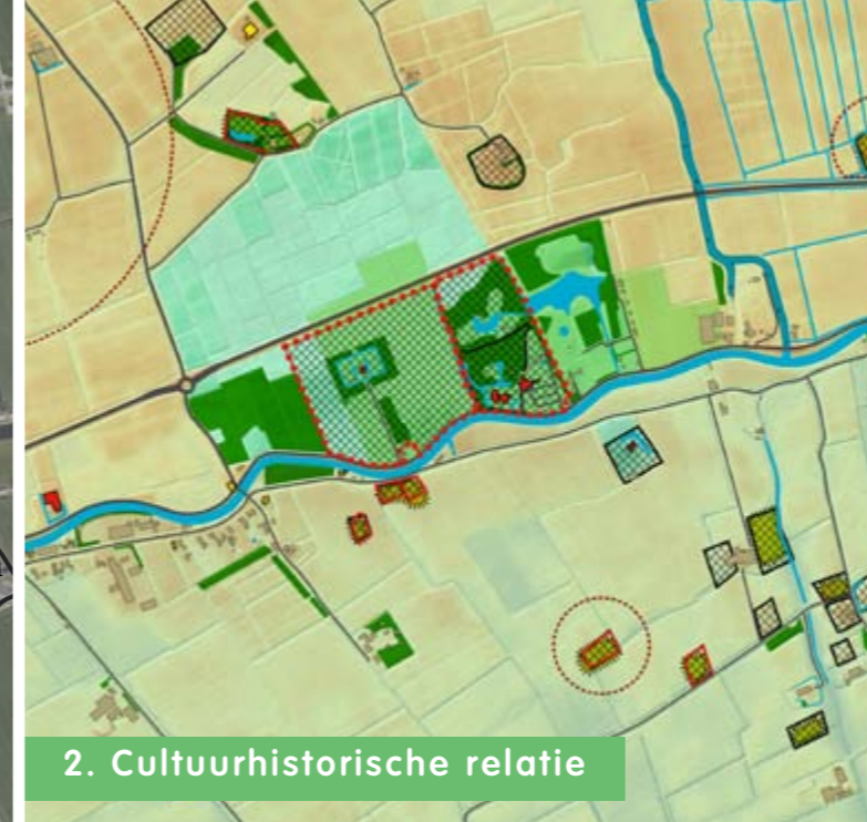
2. Cultuurhistorische relatie