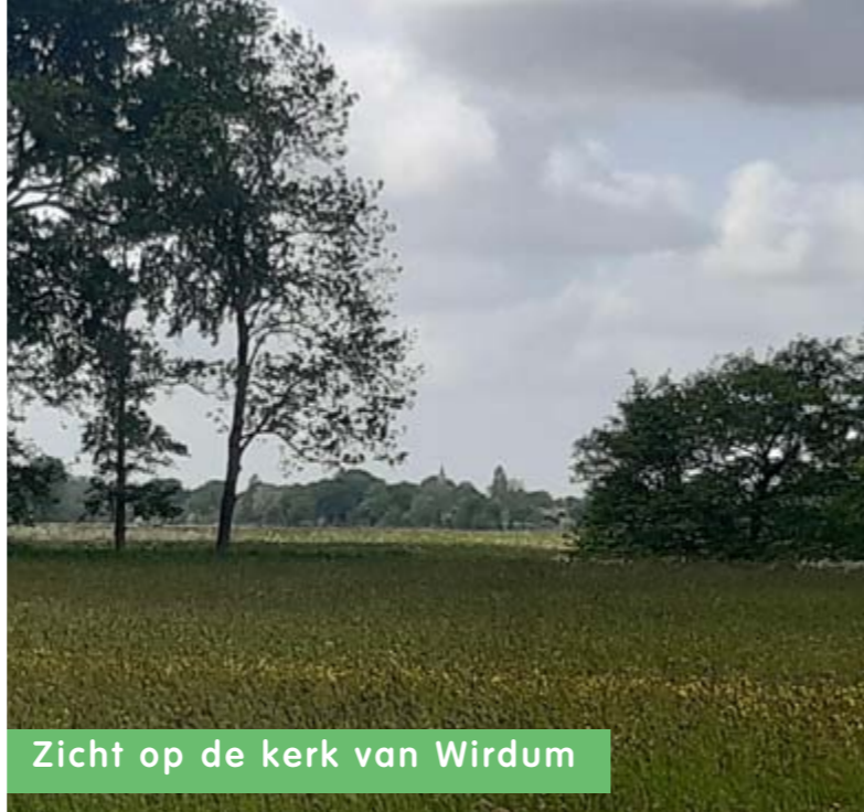
Zicht op de kerk van Wirdum