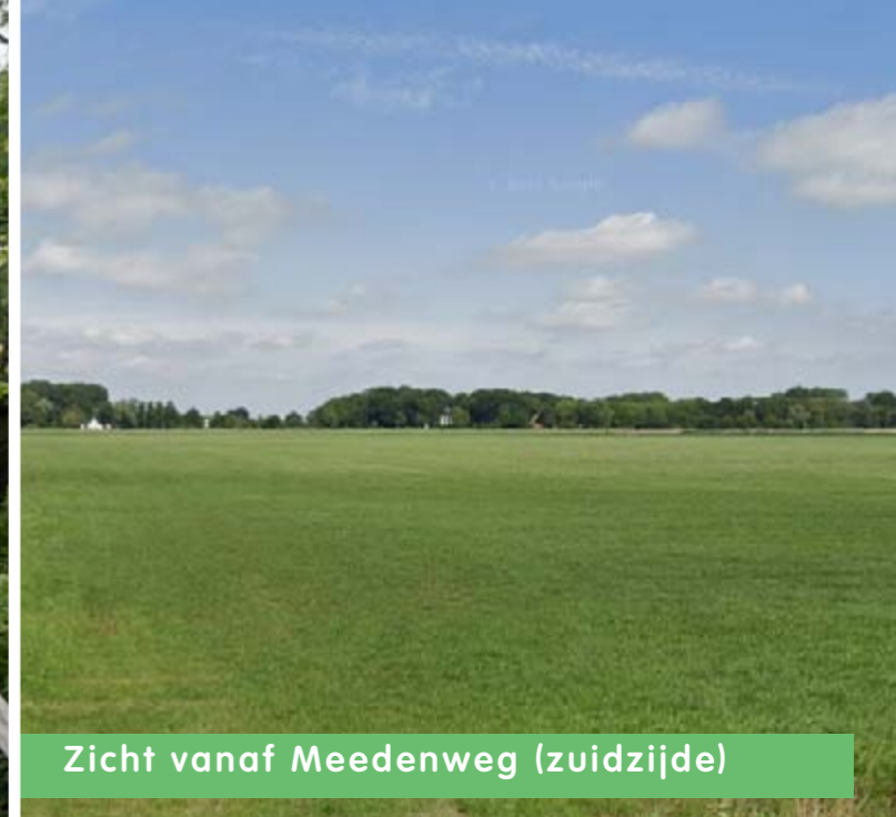
Zicht vanaf Meedenweg (zuidzijde)