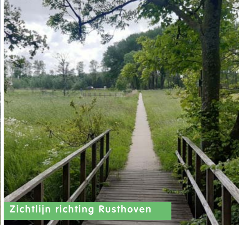
Zichtlijn richting Rusthoven